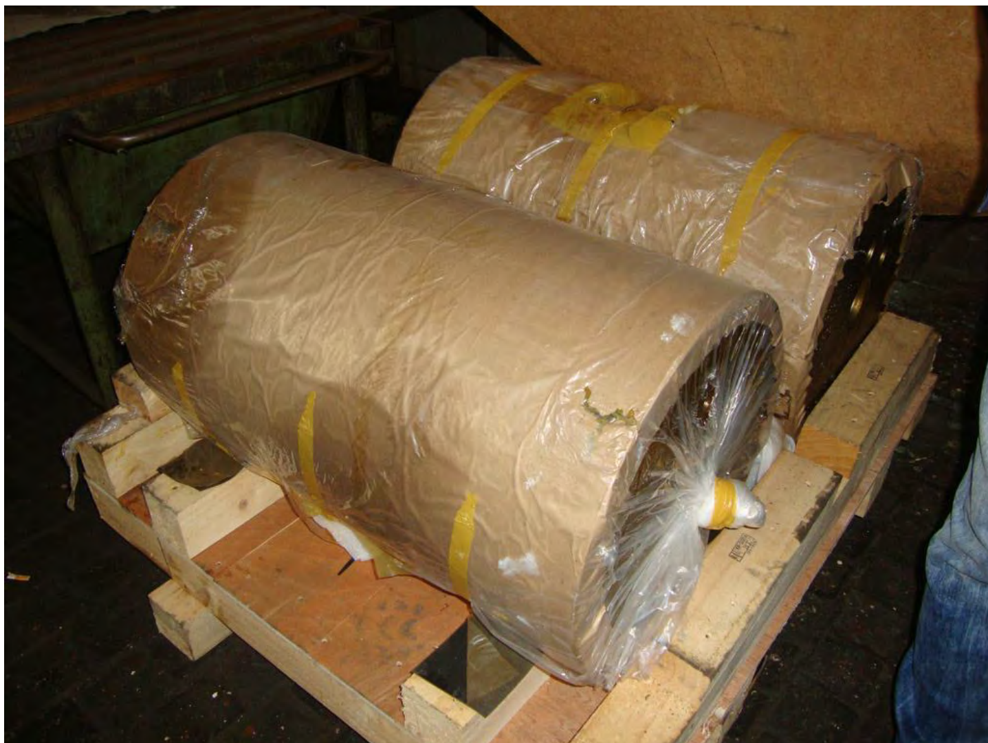
Paletirani postojeći dijelovi brodskog motora za gradnju br. 526

Primjer oznaka na sanducima sa zapakiranim postojećim dijelovima motora za gradnju br. 526