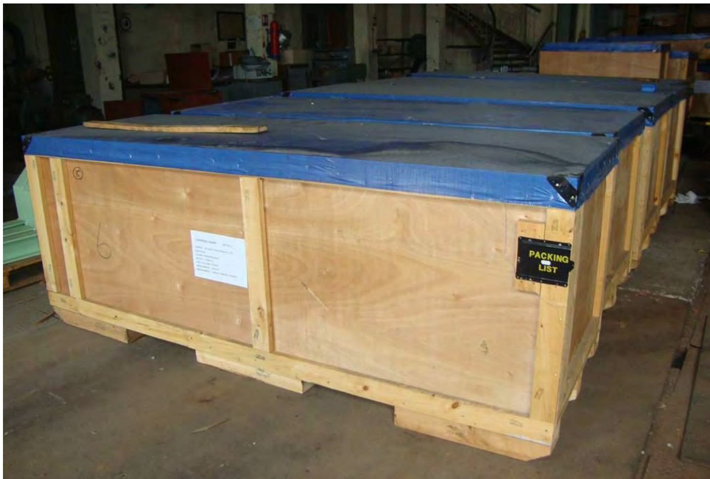
Skladišteni postojeći dijelovi broskog motora za gradnju br. 526