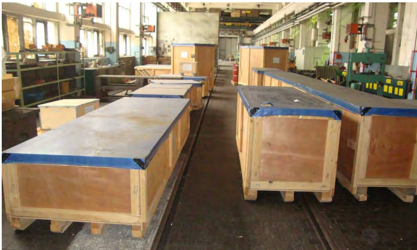
Skladišteni i pakirani postojeći dijelovi brodskog motora za gradnju br. 526