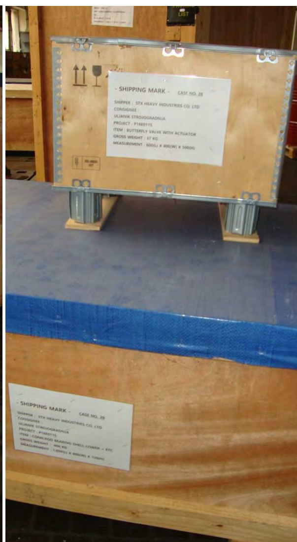
Zapakirani u sanducima postojeći dijelovi brodskog motora za gradnju br. 526